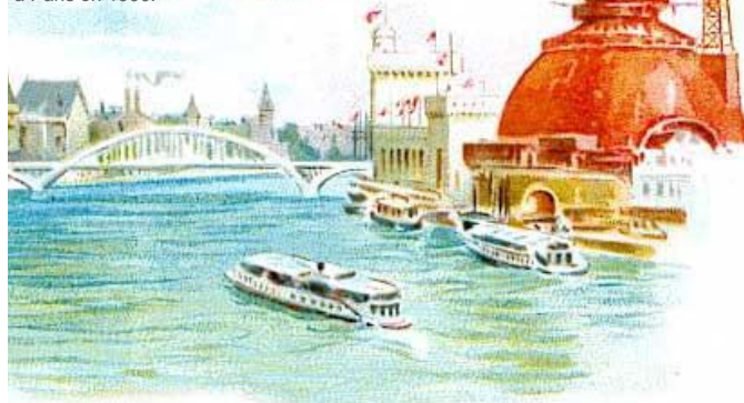
L'exposition universelle à Paris en 1900.